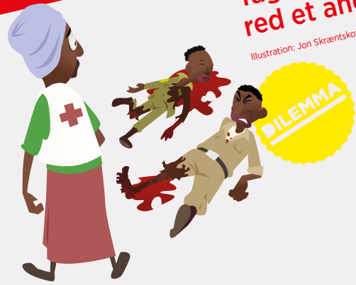
Illustration: Jon Skræntskov/Tintank

Tag med ud i verden for Røde Kors, og red et andet menneske side 13