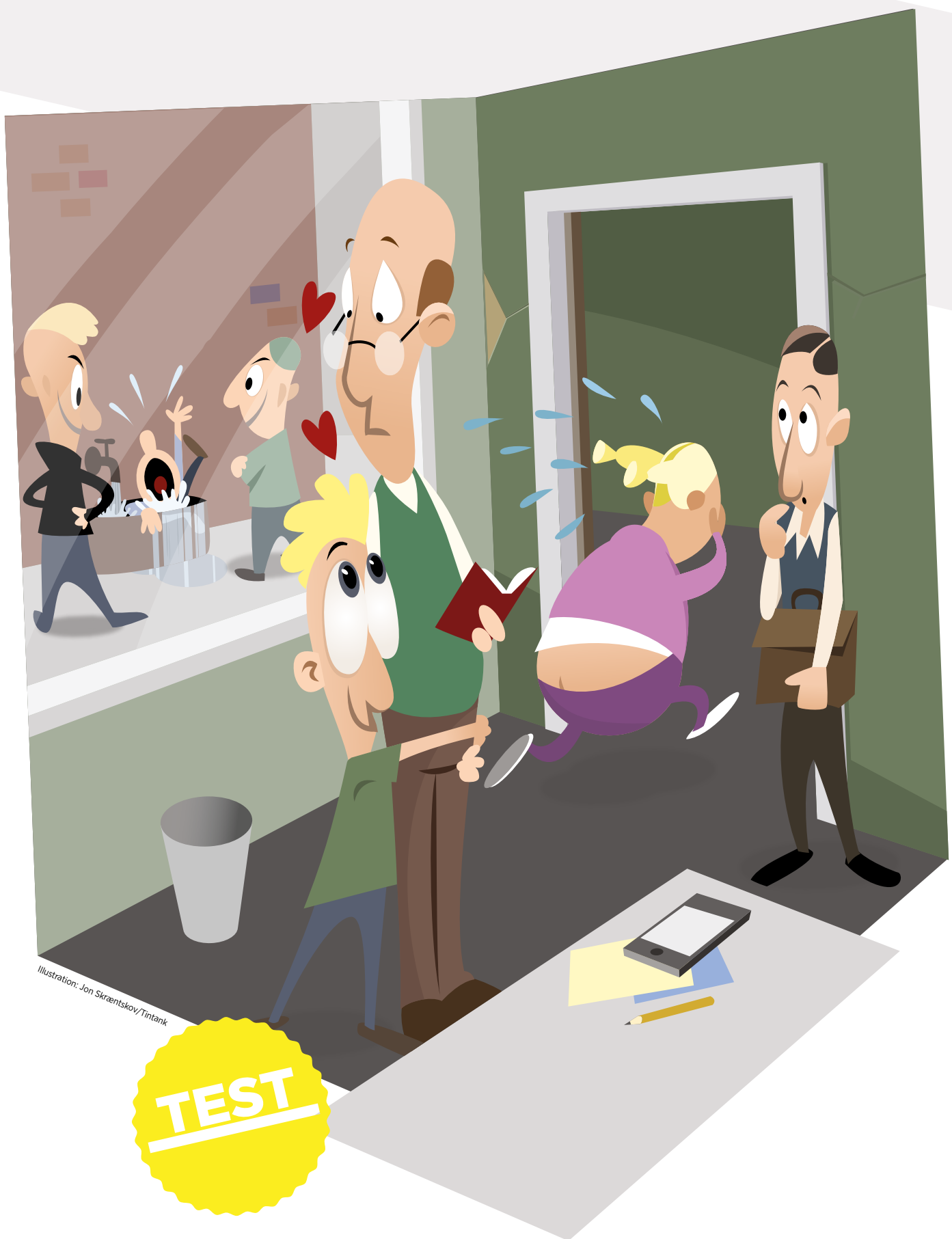
Illustration: Jon Skraentsov/Tintank