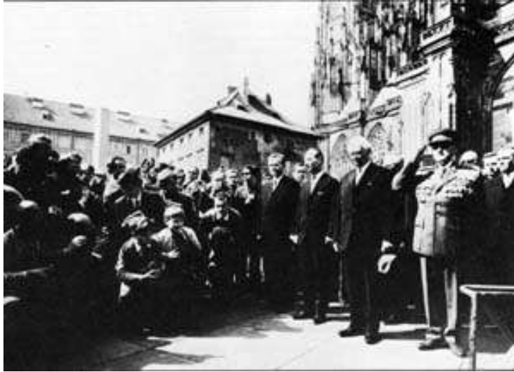
Prag d. 1. maj 1968 med Dubcek