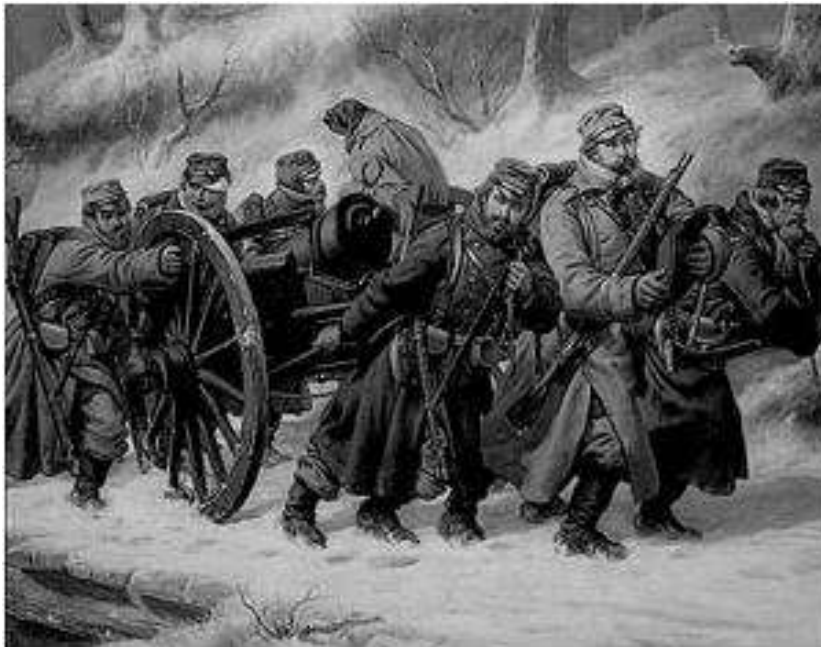
Tilbageetogene fra Dannevirke – februar 1864 – kildeangivelse: Niels Simonsen, malet 1865 – billedet hænger i dag på Frederiksborgmuseet i Hillerød

Når der arbejdes med billeder i historieundervisningen er det vigtigt også at undersøge om billedet eller fotoet er forfalsket eller manipuleret. Der findes en række klassiske berømte eksempler på billedforfalskninger.