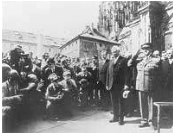
Prag d. 1. maj 1968 uden Dubcek

Fotografen der tager et historisk foto er et førstehåndsvidne, som bare ved sin blotte tilstedeværelse påvirker den virkelighed som han fotograferer. Et foto er ikke en objektiv gengivelse af virkeligheden, men en bevidst udvalgt del af denne som fotograferes med et bestemt formål for øje. Et foto kan afkodes og tolkes som ethvert andet billede jf. billedanalysemodellen. Forfalskede og manipulerede billeder kan introducere eleverne til begreberne retouchering, klipning og montage. Nogle historiske fotos er efterhånden blevet til ikonbilleder, fx billedet af det første menneske på månen fra 1969. En god billedkildeøvelse med eleverne er at finde gamle billeder fra lokalsamfundet fra det lokalhistoriske arkiv og lade eleverne med deres mobiltelefoner eller digitalkameraer forevige de samme historiske steder og lokaliteter som findes på de gamle