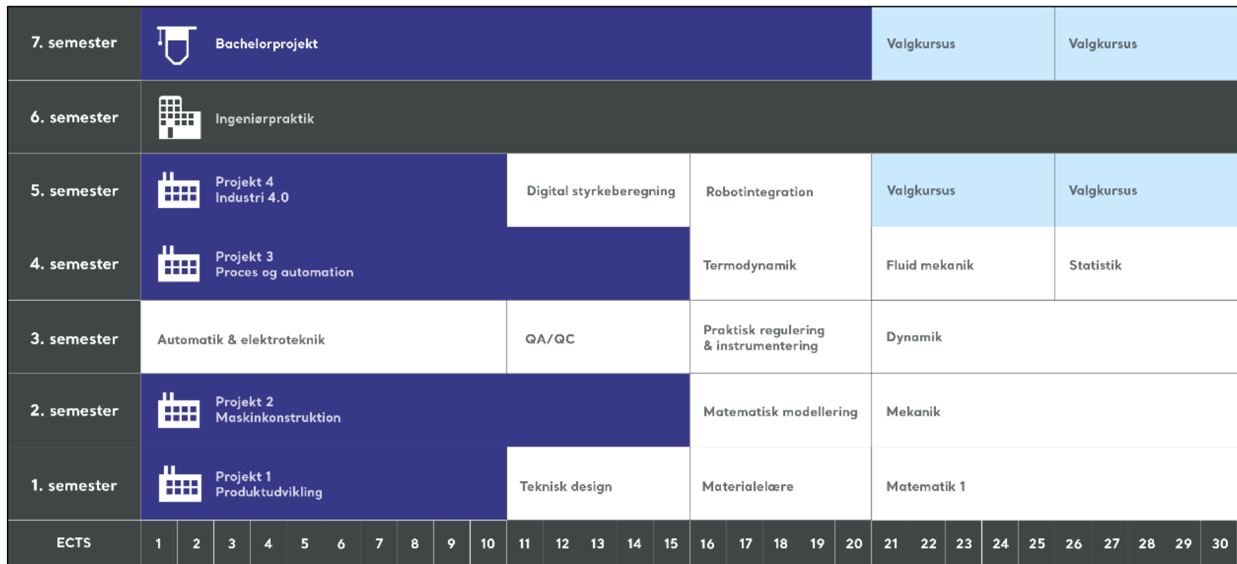
Fig. 1 Uddannelsens opbygning og struktur. For hvert semester er der angivet hvilke fag, der indgår samt ECTS-fordeling. Det skal understreges, at alle kurser på f.eks. 1. semester (Projekt 1, Teknisk Design, Materialelære, Matematik 1) forløber samtidig og afsluttes i samme prøveperiode.